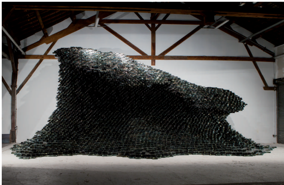
The Big Wave , 2018. Verre indien, métal. Vue de l'œuvre dans l'atelier parisien de l'artiste.

5.50 x 15 x 5 m.