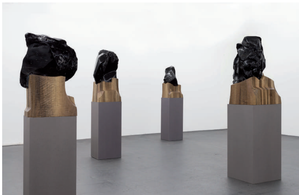
Invisibility Face , 2015. Obsidienne, socle en bois de marronnier. 105 x 55 x 60 cm.