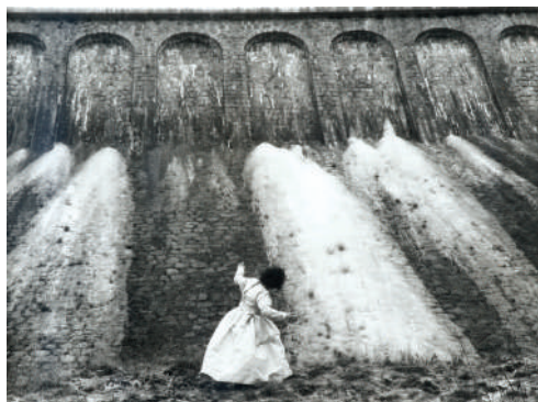
Autoportrait en robe de prêtre , 1986.

Ces sculptures bien qu'abstraites renvoient à la statuaire classique des bustes, avec les rapports de proportion entre le socle en bois et la pierre taillée. L'obsidienne, cette pierre noire qu'affectionne particulièrement Jean-Michel Othoniel, fonctionne ici comme un miroir restituant notre reflet distordu, livré à notre imaginaire. À la fois ombre et lumière, ses sculptures nous mettent face à nous-mêmes, à notre inconscient. Elles renvoient entre autres aux miroirs en obsidienne utilisés dans plusieurs cultures anciennes, qui étaient considérés comme une porte entre le monde réel et le royaume des esprits.