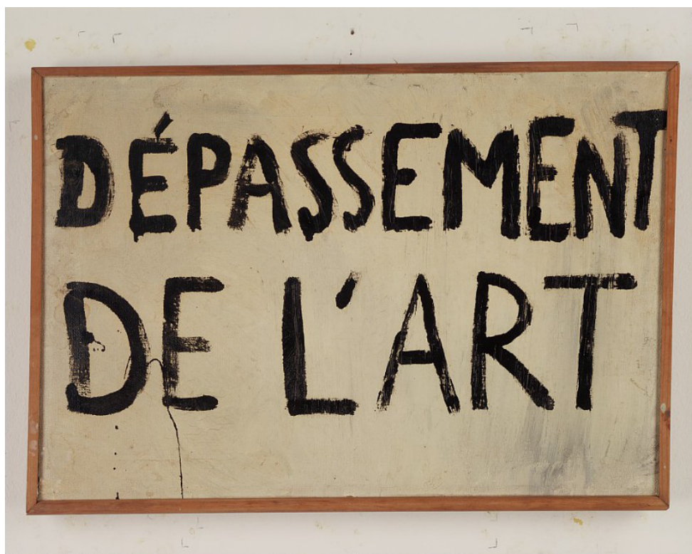
Guy Debord, Dépassement de l'art , « Directive n° 1 », 17 juin 1963, Huile sur toile, 41,4 x 60,2 cm, collection particulière.