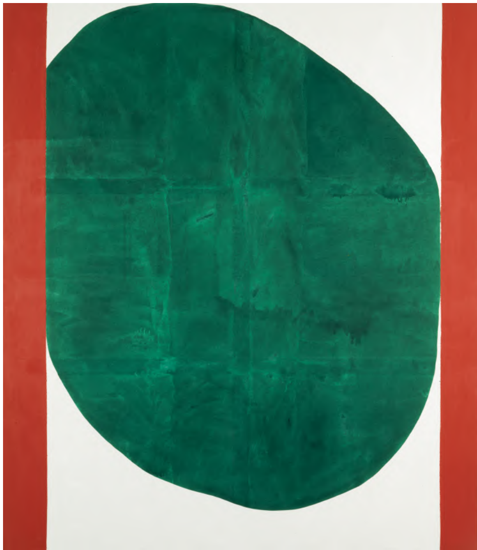
Vincent Bioulès , Issanka , 1969, coll. MAMC+. © ADAGP, Paris. Photo : Yves Bresson / MAMC+ Saint-Étienne Métropole

À découvrir au MAMC+ une programmation de quatre expositions qui interrogent les missions du Musée : aussi bien la conservation et l'enrichissement de la collection, que le travail avec des artistes contemporains.