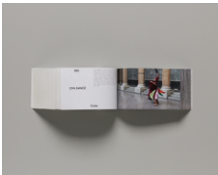
Anouk Kruithof , Universal Tongue , Art Paper Editions, Gand, 2021, année d'acquisition : 2021.

Avec Augure , réalisé à partir de coupures de presse des années 1960 et 1970, il s'intéresse à la photographie d'actualité qu'il confronte à l'iconographie commerciale. Dans ce mélange, il devient difficile de définir le registre de chaque image. L'histoire se transforme en interprétation où les codes et les signes sont dissimulés au sein de cet essai visuel.