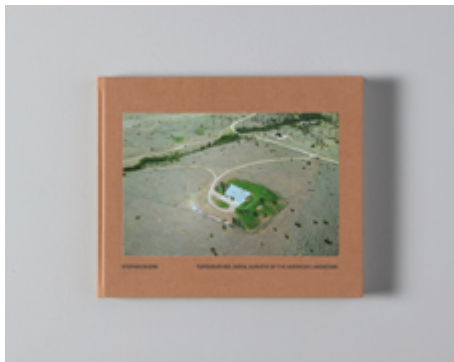
Stephen Shore , Topographies: Aerial Surveys of the American Landscape , 2023, Mack, Londres, 2023, année d'acquisition : 2023.

Topographies: Aerial survey of the American Landscape est un ensemble de photographies de paysages américains prises par un drone équipé d'une caméra depuis l'épidémie de Covid en 2020. Stephen Shore, photographe américain né à New York en 1947, poursuit avec cet ouvrage l'exploration des territoires des États-Unis. Il a notamment participé à l'exposition qui a redéfini l'approche du paysage américain, « New Topographics » en 1975. Le point de vue, choisi en hauteur, fait écho aux premières utilisations de la photographie aérienne. La cartographie de territoire, notamment développée lors de la Première Guerre mondiale, est ici reliée par l'artiste aux technologies actuelles de la géolocalisation.