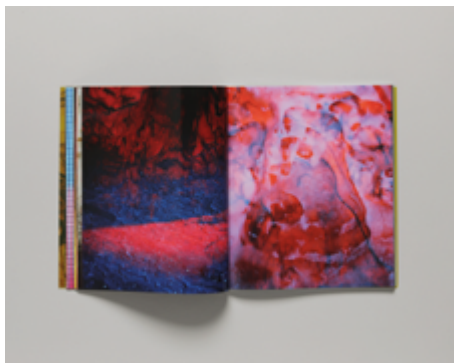
Philippe Durand , Chauvet , RVB Books, Paris, 2021, année d'acquisition : 2021.

Topographies: Aerial survey of the American Landscape est un ensemble de photographies de paysages américains prises par un drone équipé d'une caméra depuis l'épidémie de Covid en 2020. Stephen Shore, photographe américain né à New York en 1947, poursuit avec cet ouvrage l'exploration des territoires des États-Unis. Il a notamment participé à l'exposition qui a redéfini l'approche du paysage américain, « New Topographics » en 1975. Le point de vue, choisi en hauteur, fait écho aux premières utilisations de la photographie aérienne. La cartographie de territoire, notamment développée lors de la Première Guerre mondiale, est ici reliée par l'artiste aux technologies actuelles de la géolocalisation.