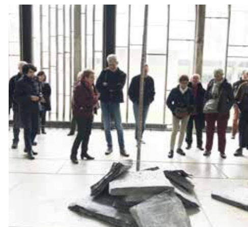
Le groupe des Amis en visite