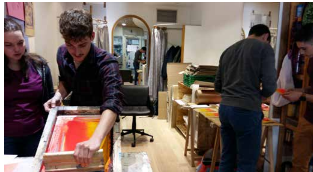
L'Estampille : atelier de sérigraphie

2 arcades de l'Hôtel de Ville 42000 Saint-Étienne 06 84 47 37 47 - www.estampille-editions.com