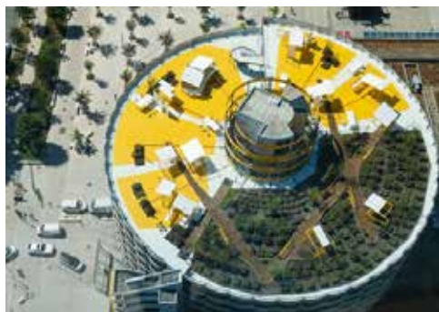
Mengzhi Zheng, Inarchitectures, 2019. Jardin suspendu, Lyon Parc Auto, Les Halles Bocuse, Lyon. Commande artistique in situ, pour la rénovation du parc LPA Les Halles de Lyon. En collaboration avec le cabinet William Wilmotte - WW Architecture, Anne-Laure Giroud paysagiste, Art Entreprise. © Adagp, Paris, 2019

Nous le retrouverons le samedi 14 mars 2020 dans son atelier lyonnais. Places limitées au nombre de 8 participants.