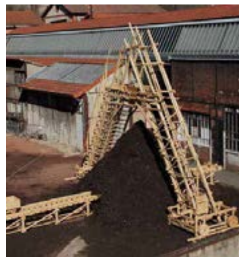
Boris Raux, La Révolution Lignivore, 2019 Sapin du Pilat, 10kg de clous et 25m3 de compost installation in-situ d'environ 14m x 8m x 8m Puits Couriot, Parc-Musée de la Mine, Saint-Étienne

Boris Raux , artiste de l'olfaction, est un artiste chercheur. Ce stéphanois d'adoption explore la dimension olfactive dans l'art contemporain.