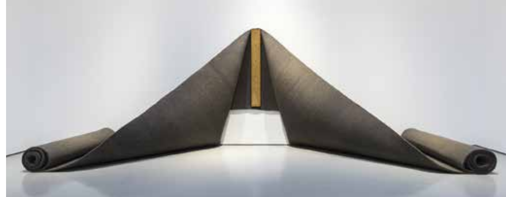
Robert Morris, Sans titre, 1968 – 1972 – © Adagp, Paris

Nouveaux tarifs : adhérent 5 euros et non adhérent 10 euros. Gratuité pour les étudiants de moins de 25 ans, les demandeurs d'emploi, les personnes handicapées. BILLETS vendus sur place à partir de 18h30 ; réservation inutile. Programme actualisé sur le site : lesamisduamc.com et sur facebook.com/AAMAMC