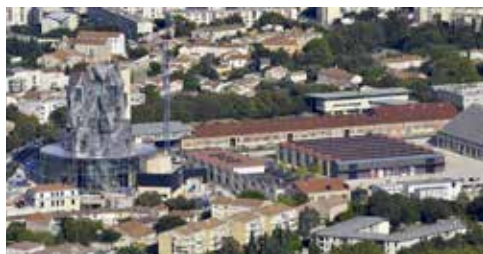
Fondation Luma, Arles

Les Amis seront informés dès que l'ensemble sera mis en place.