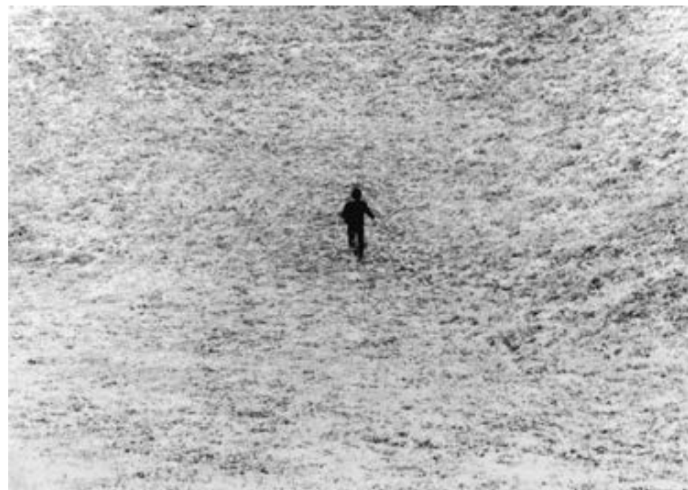
Giovanni Anselmo, Entrare nell'opera , 1971, tirage noir et blanc sur toile, 336 x 491 cm. Coll. Fundação de Serralves - Museu de Arte Contemporânea, Porto, Portugal. © Giovanni Anselmo, courtesy Archivio Anselmo.

Tout d'abord, nous souhaitons une excellente année à tous les Amis du Musée , riche de découvertes, d'art et d'émerveillement. Merci encore à tous pour votre soutien et vos actions à nos côtés.