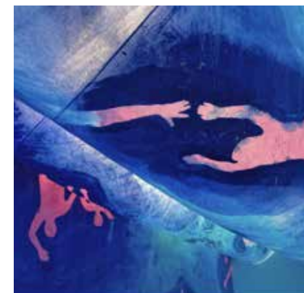
Charlotte Denamur, Rosées bleues (détail), 2019

Peindre est aussi une expérience physique et sensorielle de la couleur dans l'espace. L'artiste tente de permuter dans l'exposition les mêmes rebondissements que ceux de l'atelier. Sa pratique est en relation directe avec les volumes et dimensions du lieu d'accueil où la peinture s'infiltré, s'étend, se pose, s'élève, ou englobe. »