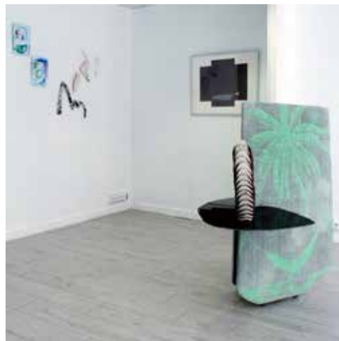
Exposition Speed data base, commissarié par Maison Pieuvre/Antoine Palmier Reynaud, Œuvres de Benjamin Collet, Nicolas Momein, Lucille Uhrich

Carbone 20 est la seconde édition de la Biennale Carbone qui avait eu lieu en avril 2018. Cet événement devient par sa qualité une Biennale de collectifs et lieux d'artistes . Carbone 20 se déroulera du 9 avril au 19 avril 2020. Elle se déploiera dans toute la ville de Saint-Étienne. Plus de 25 structures de diffusion d'art contemporain nationales et internationales reconnues seront invitées, ainsi que des structures régionales.