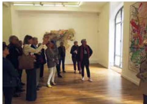
Le groupe des Amis visite l'exposition Nancy Graves à la Galerie Ceysson et Bénétière