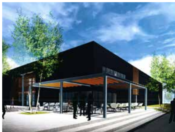
Le projet d'implantation de la future galerie (Francis Grousseau architecte)