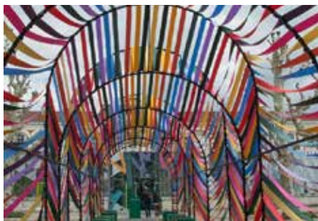
Jeanne Goutelle, La Passerelle de l'inclusion – Biennale du design – Saint-Étienne 2019