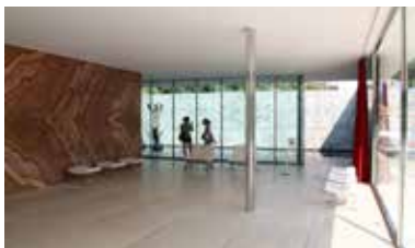
Pavillon allemand de l'exposition de Barcelone 1929 arch. : Ludwig Mies van der Rohe

Nous espérons vous retrouver nombreux à nos conférences. Des tarifs préférentiels sont consentis aux adhérents pour les conférences organisées par Les Amis du Musée : adhérent 6 euros et non adhérent 8 euros. Gratuité pour les étudiants de moins de 25 ans, les demandeurs d'emploi, les personnes handicapées. Billets vendus sur place à partir de 18h30 ; réservation inutile. Vous pouvez retrouver notre programme actualisé sur le site : https://lesamisduamc.com