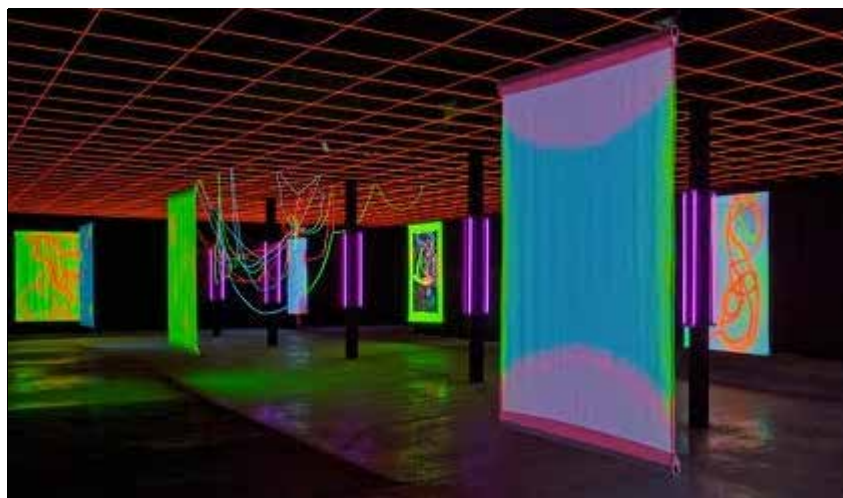
Greenhouse à Saint-Etienne

Aujourd'hui, il continue son activité artistique et enseigne à l'École des Beaux-arts d'Annecy. Vous pouvez retrouver l'ensemble de son œuvre sur le site web du réseau national Documents D'Artistes Auvergne Rhône-Alpes .