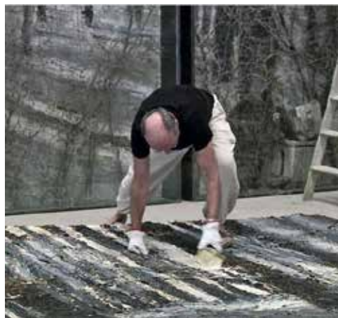
Anselm Kiefer dans son atelier