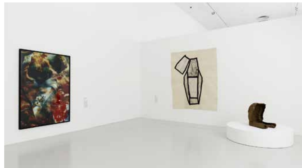
Vue de l'exposition The House of Dust.