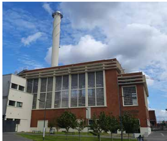
Fondation Fimincó à Romainville