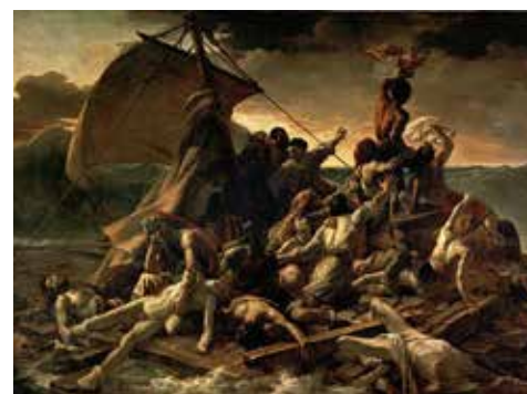
Théodore Géricault, Le Radeau de la méduse