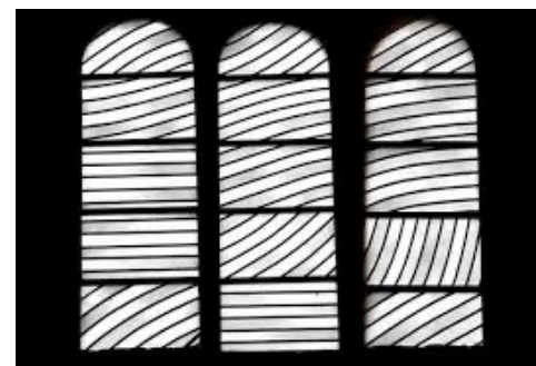
Vitrail de Pierre Soulages à Conques