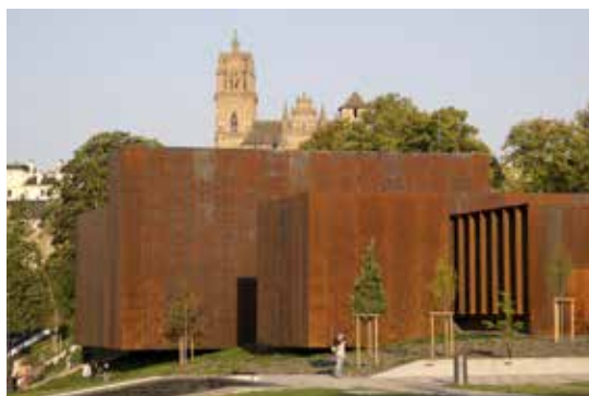
Musée Pierre Soulages à Rodez

Nous vous proposons trois jours dans le Massif Central au printemps 2023, en covoiturage. Pierre Soulages , artiste peintre et graveur, nous laisse un immense héritage. Il a travaillé sur les reflets dans la couleur noire, qu'il a appelée outrénoir . Pratiquant l'art abstrait, il était l'un des principaux représentants de la peinture informelle. Né à Rodez, à 12 ans il visite Conques en famille et se passionne pour l'art roman. Il annonce qu'il désire devenir artiste. Rodez abrite la plus grande collection au monde de l'artiste. Il a légué à l'agglomération 500 de ses œuvres en 2005. Le Musée Soulages a été construit pour les exposer à partir de son achèvement en 2014 à proximité du centre historique. Il est conçu comme « un musée dans un jardin », architecture futuriste et originale due au groupe espagnol RCR Arquitectes associé à Passerac et Roques . Il prend la forme d'un long socle duquel émergent cinq volumes d'acier rouge corrodé. Il s'inscrit parfaitement dans le panorama de la ville et permet la vue sur le paysage lointain, le plateau de l'Aubrac. Le musée propose également des expositions temporaires d'artistes modernes et contemporains.