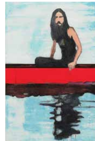
Peter Doig, Il y a 100 ans, 2001