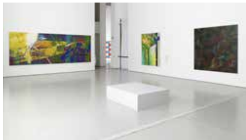
Vue de l'exposition Double Je – Donation Durand-Dessert & collections MAMC+, au mur œuvres de Gerhard Richter, Photo : A.Mole/MAMC+, © G. Richter

Conférence en lien avec l'exposition Double Je Donation Durand-Dessert et collections du MAMC+