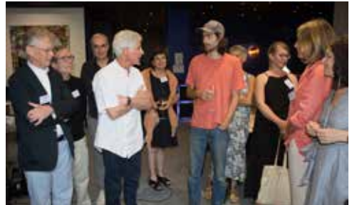
Jury de la résidence 2020

Aujourd'hui cette résidence est encore plus nécessaire qu'elle a pu l'être lors des éditions précédentes. Il est essentiel de proposer des conditions favorables pour la création émergente : les artistes ont plus que jamais besoin d'être soutenus dans leurs démarches de création.