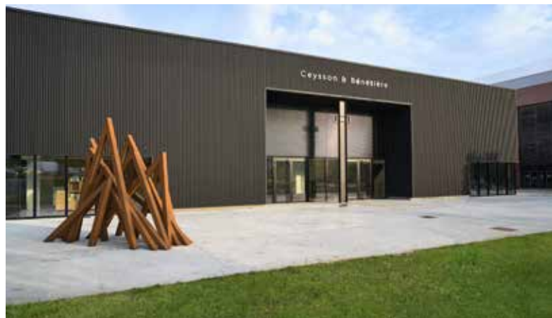
La nouvelle galerie Ceysson et Bénétière