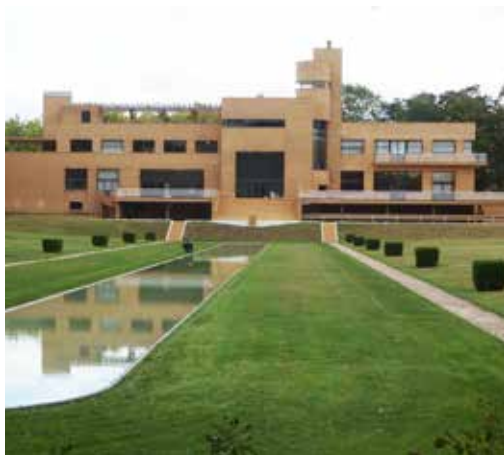
La Villa Cavrois à Croix (Robert Mallet-Stevens architecte)

Voyage de 4 jours en train et en autocar.