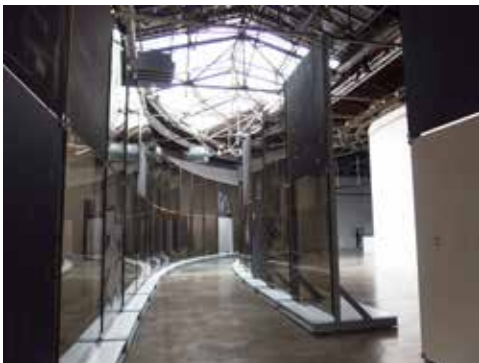
Dans l'exposition Carte blanche à Anne Imhof, Palais de Tokyo, 2021