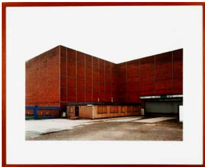
Thomas Ruff, Haus n°8 III 1/4 1 er avril 1988

Au plaisir de vous accueillir très bientôt au Musée.