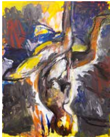
Elke VI , octobre 1976, MAMC+, © Baselitz

De l'expressionnisme allemand à la peinture contemporaine