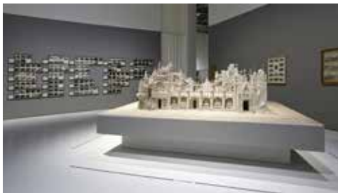
Vue de l'exposition L'Énigme autodidacte

Conférence en lien avec l'exposition L'Énigme autodidacte