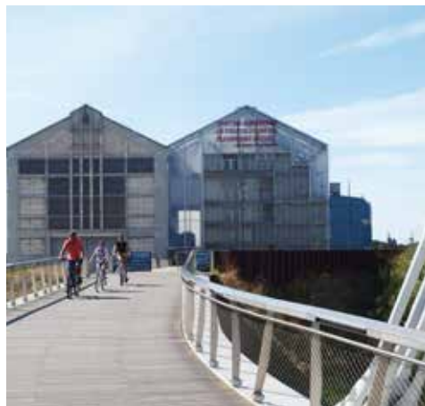
Le FRAC Grand Large – Hauts de France à Dunkerque